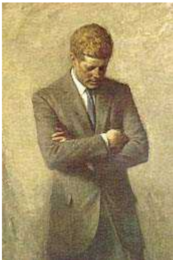
John F. Kennedy