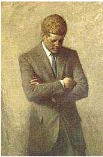
John F. Kennedy